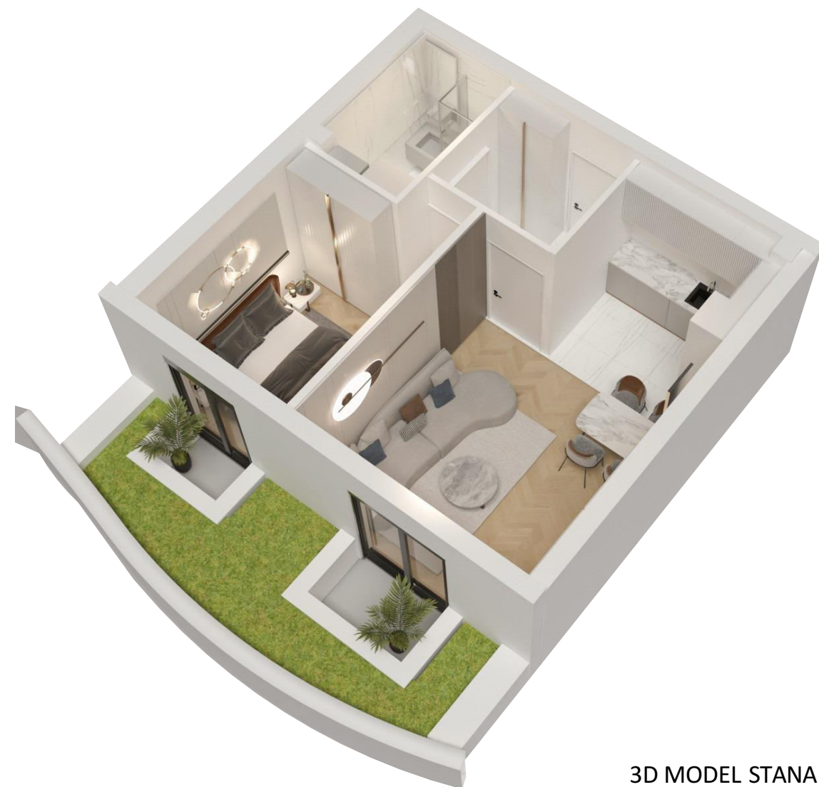
3D MODEL STANA